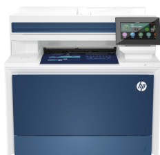
Impressora HP Color LaserJet Pro MFP 4303dw

Essa impressora destina-se a funcionar somente com cartuchos que tenham um chip da HP novo ou reutilizado e aplica medidas de segurança dinâmica para bloquear cartuchos que usem um chip de terceiros. As atualizações periódicas de firmware manterão a eficácia dessas medidas e bloquearão cartuchos que funcionaram anteriormente. Um chip da HP reutilizado permite a utilização de cartuchos reutilizados, remanufaturados e recarregados. Para mais informações, acesse a: http://www.hp.com/learn/ds