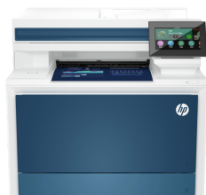
Impressora HP Color LaserJet Pro MFP 4303fdw