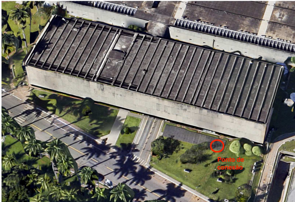
Figura 2: Ponto de conexão do gerador (Anexo II).