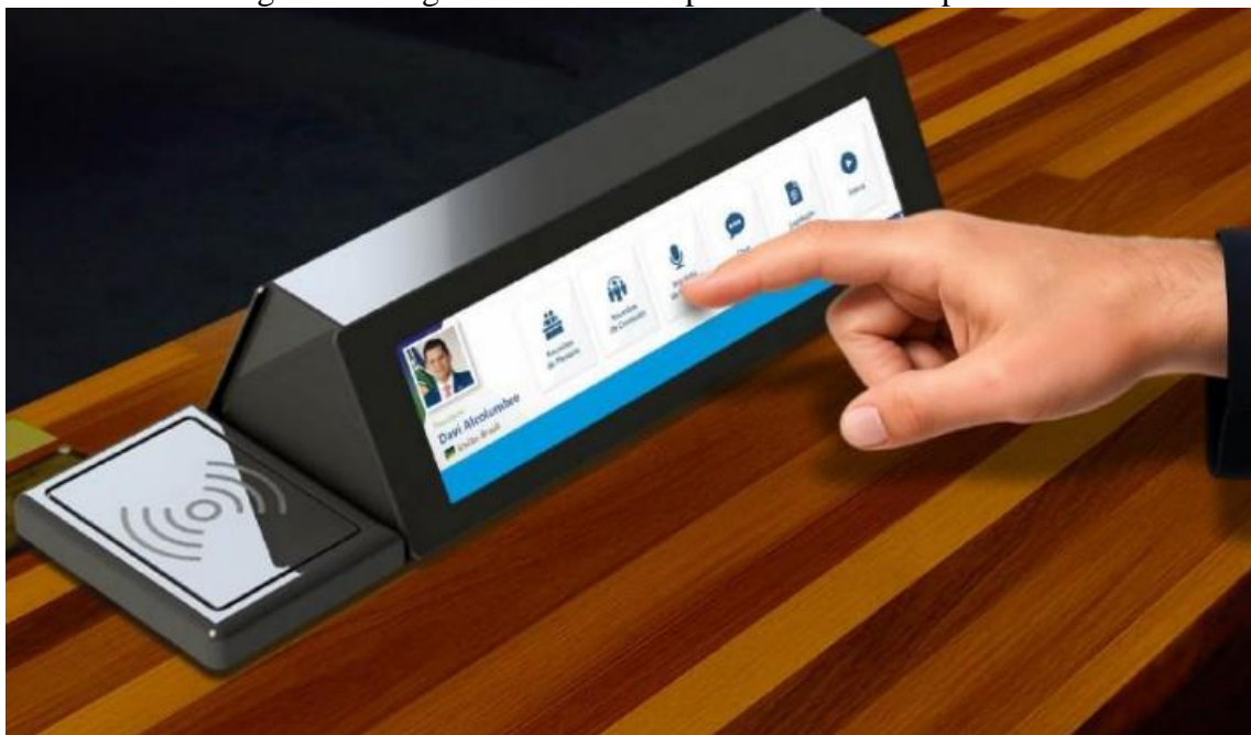
Figura 2 - Imagem ilustrativa de prisma dos novos postos, com tela sensível ao toque.