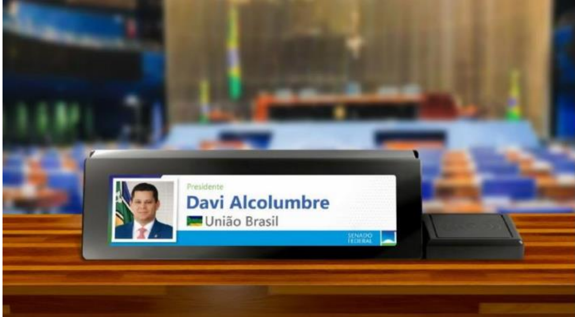
Figura 1- Imagem ilustrativa do prisma dos novos postos